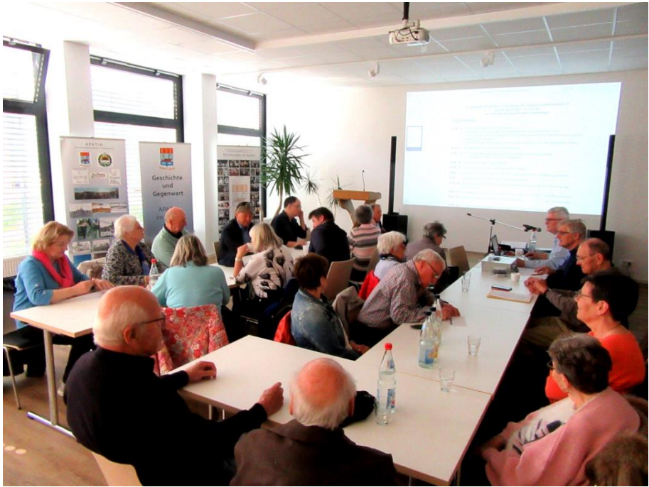
Mitglieder und Gäste